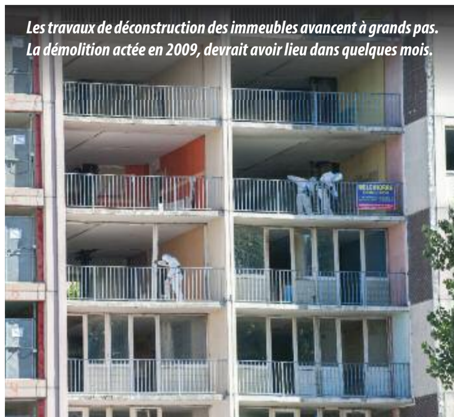
Les travaux de déconstruction des immeubles avancent à grands pas. La démolition actée en 2009, devrait avoir lieu dans quelques mois.

viendra-t-il du terrain après l'implosion des immeubles ? "Nous nous retrouverons pendant un certain temps avec des espaces en transition, reprend l'adjoint. On travaille pour que ces espaces puissent vivre et continuent à être occupés". Il le sera notamment de façon artistique avec le projet Mas stocke initié par le Grand projet de ville (GPV). "Pour le Mas du Taureau, l'objectif est de faire sortir de terre