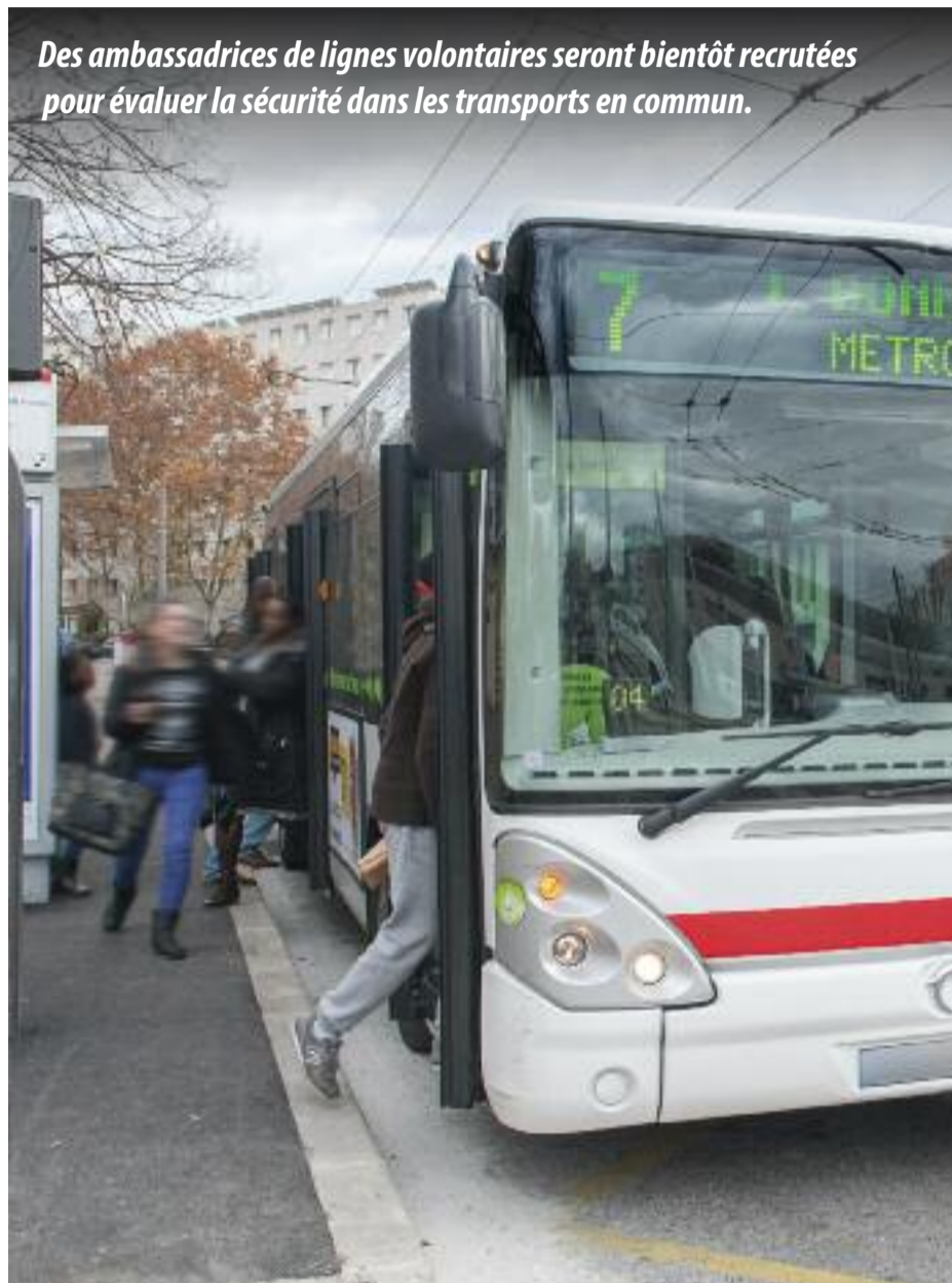
Des ambassadrices de lignes volontaires seront bientôt recrutées pour évaluer la sécurité dans les transports en commun.

Pratique : pour devenir ambassadrice de ligne, il suffit de remplir un formulaire sur le site www.sytral.fr